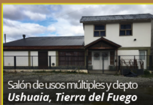
Salón de usos múltiples y depto Ushuaia, Tierra del Fuego