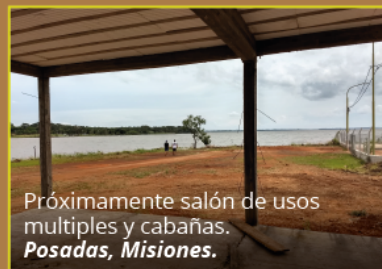
Próximamente salón de usos múltiples y cabañas. Posadas, Misiones.