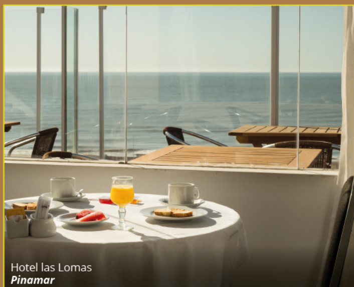
Hotel las Lomas Pinamar

LISTA MARRÓN PASADO Y PRESENTE DE LUCHA, FUTURO DE JUSTICIA.