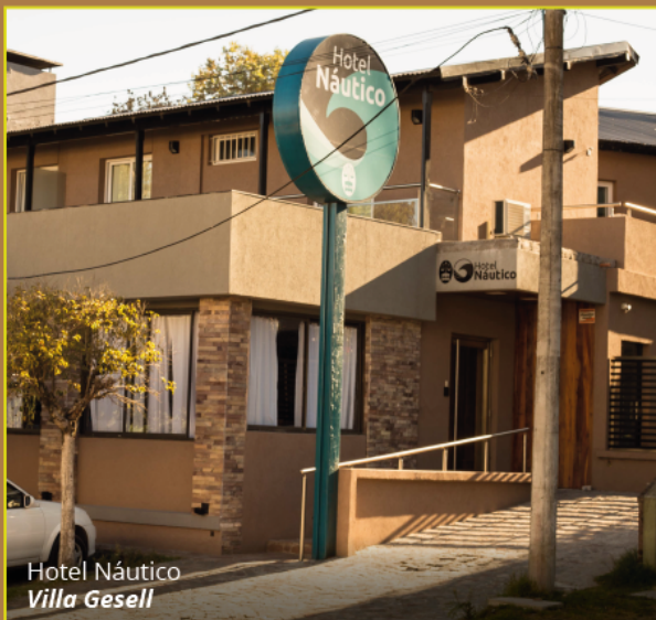
Hotel Náutico Villa Gesell