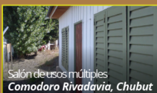
Salón de usos múltiples Comodoro Rivadavia, Chubut