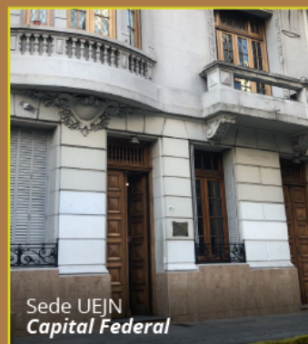
Sede UEJN Capital Federal