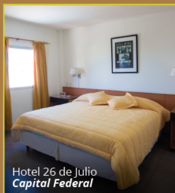
Hotel 26 de Julio Capital Federal