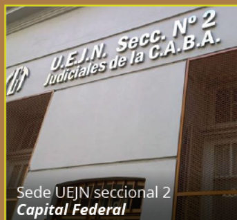
Sede UEJN seccional 2 Capital Federal