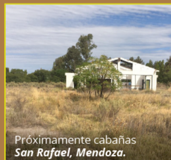
Próximamente cabañas San Rafael, Mendoza.