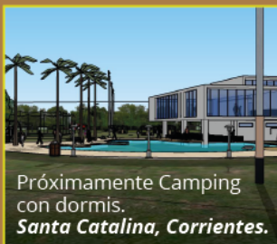
Próximamente Camping con dormis. Santa Catalina, Corrientes.