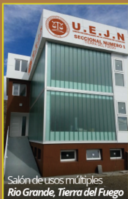
Salón de usos múltiples Rio Grande, Tierra del Fuego